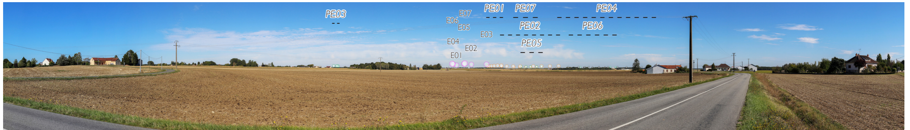
Fig. I57: Photomontage panoramique (180°)

Portion du panoramique correspondant à la vue réelle page suivante