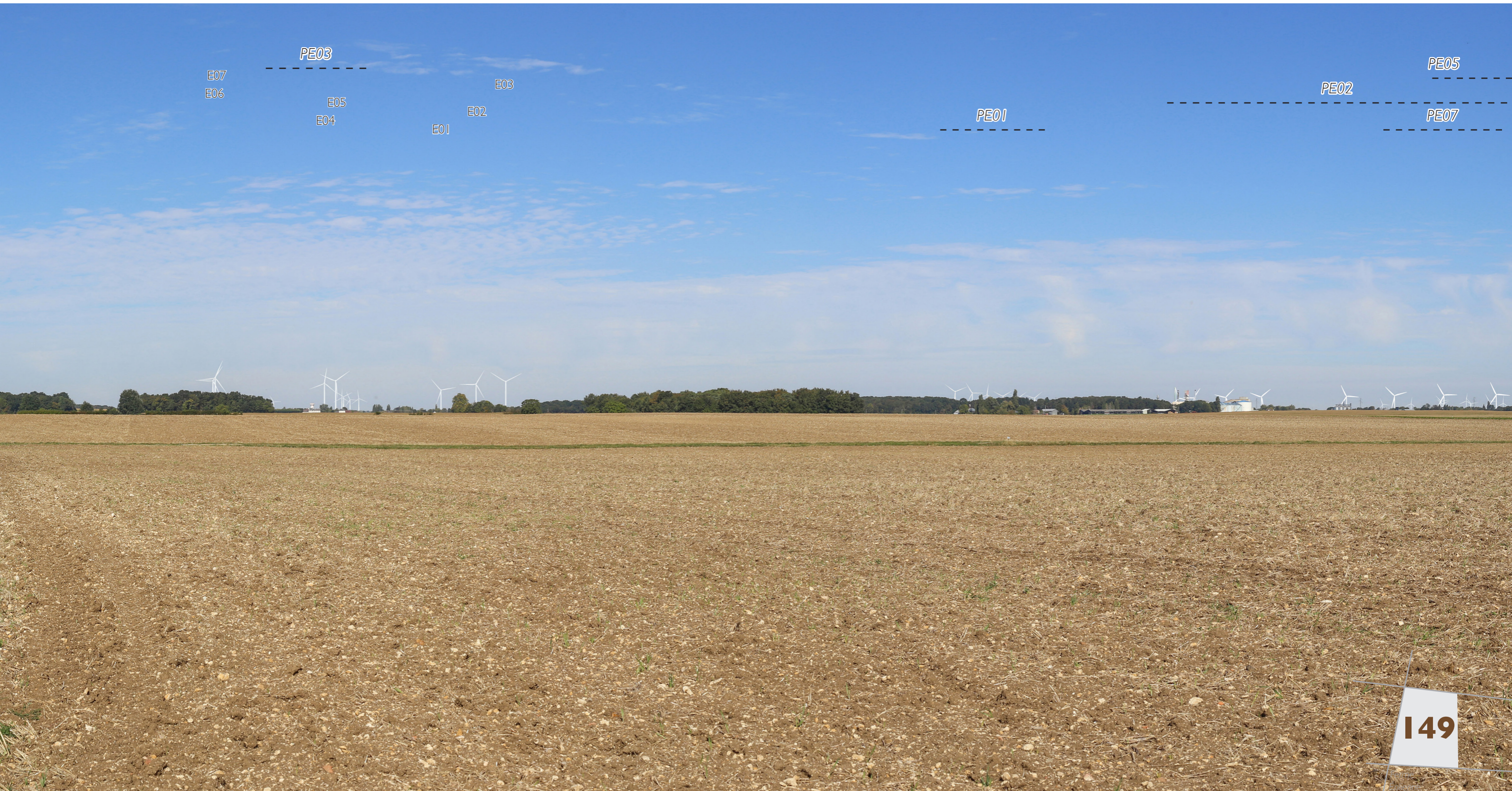
Fig. I55 : Photomontage (champ horizontal : 50°; distance de lecture 45 cm)