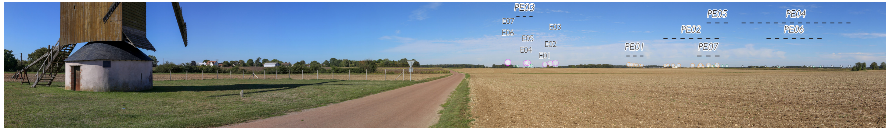
Fig. I54: Photomontage panoramique (180°)

Portion du panoramique correspondant à la vue réelle page suivante