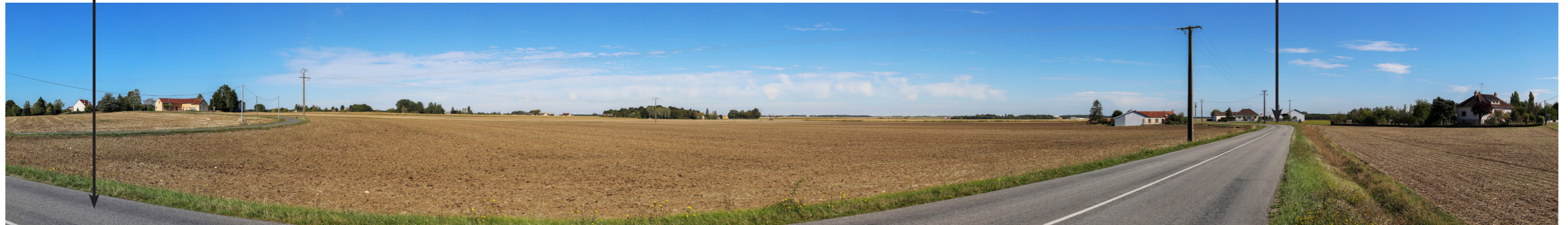
Fig. I56: Vue panoramique initiale (180°)