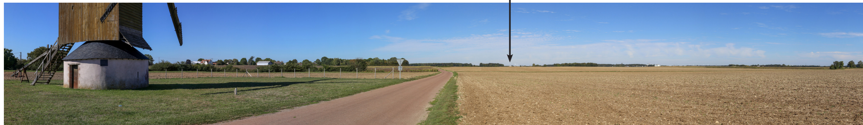
Fig. I53: Vue panoramique initiale (180°)